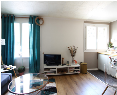
RUE DES CHÊNES - LE VESINET