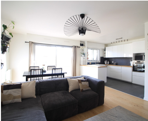
ROUTE DE MONTESSON - LE VESINET