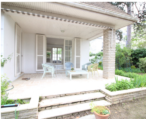
BOULEVARD DES ETATS-UNIS - LE VESINET