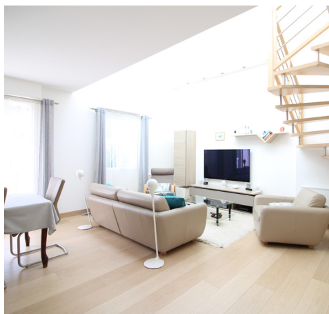
RUE DES CHARMES - LE VESINET