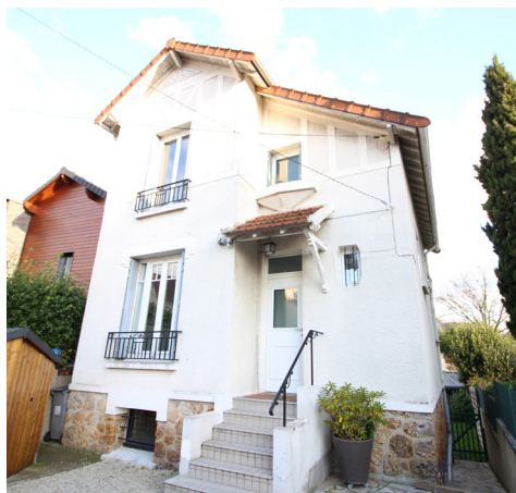
RUE DU CLOS DU VERGER - CHATOU