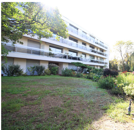
AVENUE DE LA FAISANDERIE - CHATOU