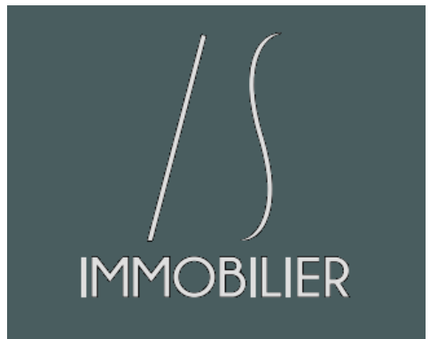
AVENUE DES PAGES - LE VESINET