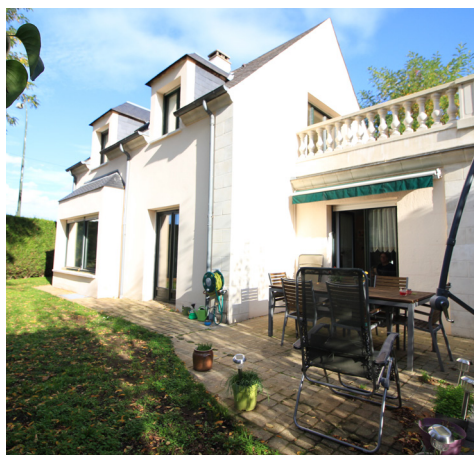
CHEMIN DU TOUR DES BOIS - LE VESINET