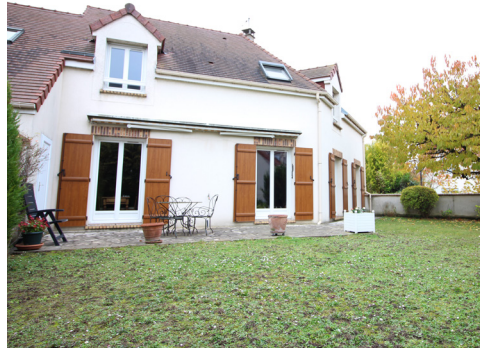
AVENUE DU GENERAL DE GAULLE - MONTESSON