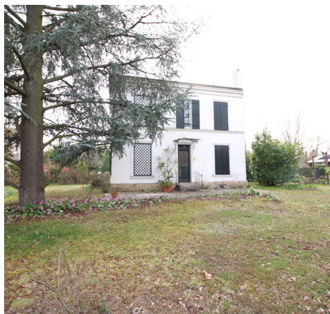
AVENUE HOCHÉ - LE VESINET