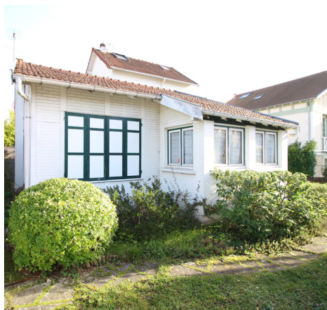
RUE PIERRE CURIE - LE VESINET