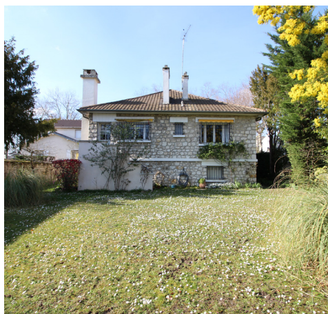
AVENUE DU GENERAL DE GAULLE - LE VESINET