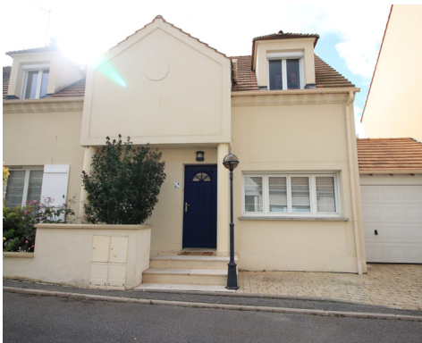
ALLÉE DES PRESOIRS - MONTESSON