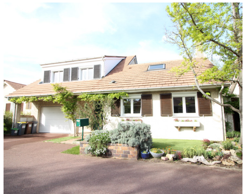
RUE DES PINS - MONTESSON