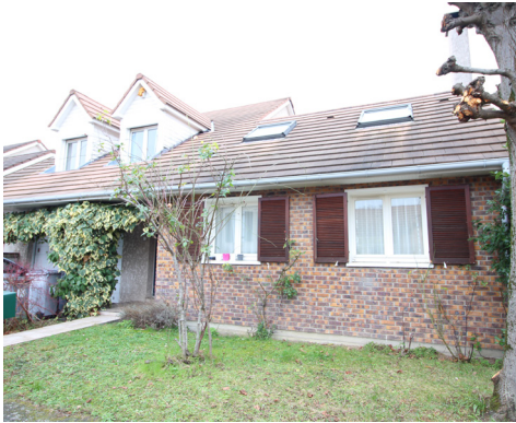
RUE ANTOINE DE ST EXUPÉRY - MONTESSON