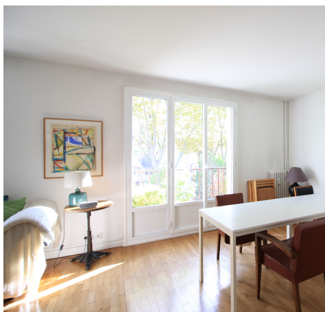
RUE DU PETIT MONTESSON - LE VESINET