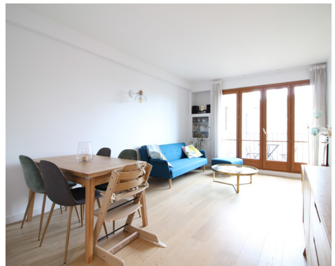
RUE ALPHONSE PALLU - LE VESINET