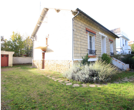
BOULEVARD DES ETATS-UNIS - LE VESINET