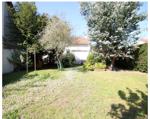
RUE GABRIEL FAURRÉ - CHATOU