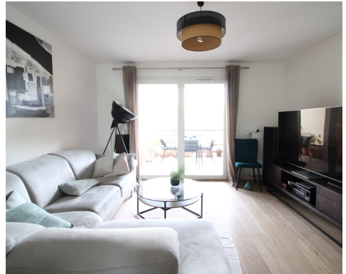
ROUTE DU VÉSINET - CHATOU