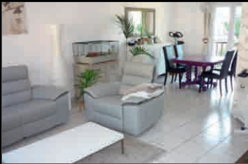
NANTEUIL LE HAUDOUIN

Centre ville de Nanteuil. Bel appartement F3 en Duplex de 66,93m 2 : entrée, grand séjour-salon, cuisine équipée, étage : dégagement, 2 chambres, SdE. Faibles charges de copro. Déco soignée. A voir rapidement ! Nb de lots en copro. : 6 - DPE : F