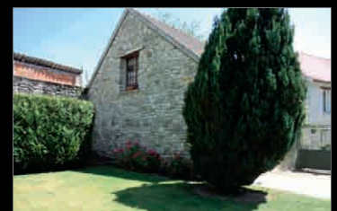
NANTEUIL LE HAUDOUIN 6 MINUTES

Maison de pays de 110m 2 : cuisine aménagée, séjour, 4 chambres dont une de 20 m 2 , salle d'eau. Cave. Grand garage indépendant de 35 m 2 . Très beau terrain clos par des murs de 290 m 2 . Beaux volumes. Commerces et école sur place. DPE : D