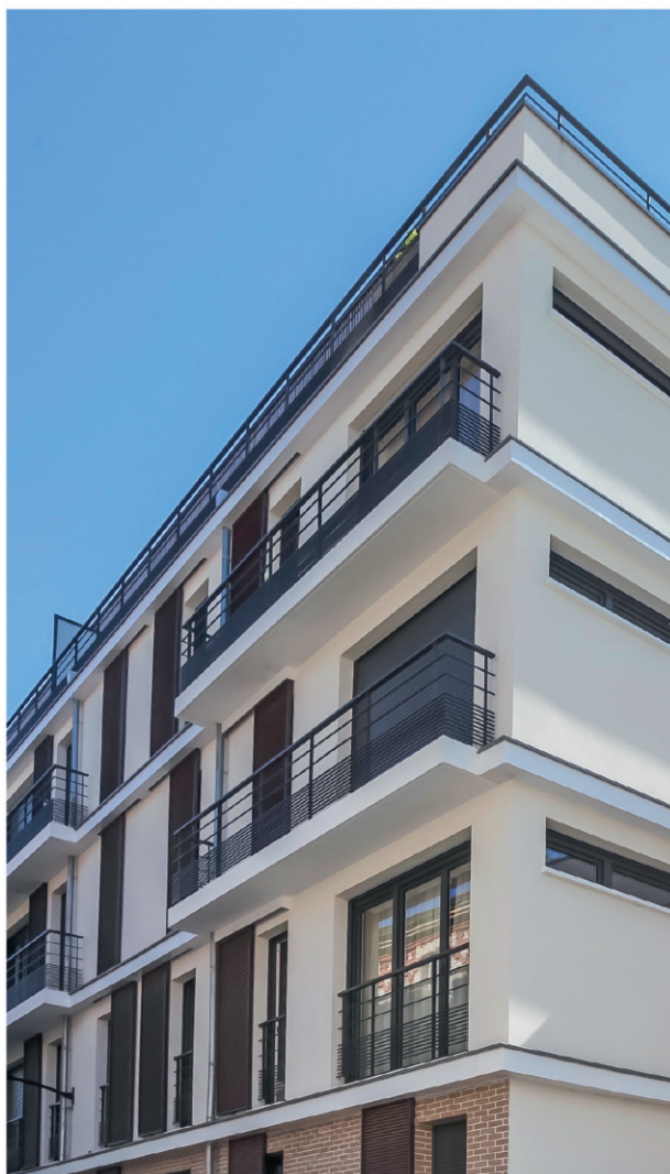
Grand Angle - 3 rue de la Côte - Viroflay 57 appartements - cabinet d'architectes : Synthèse Livré en 2017