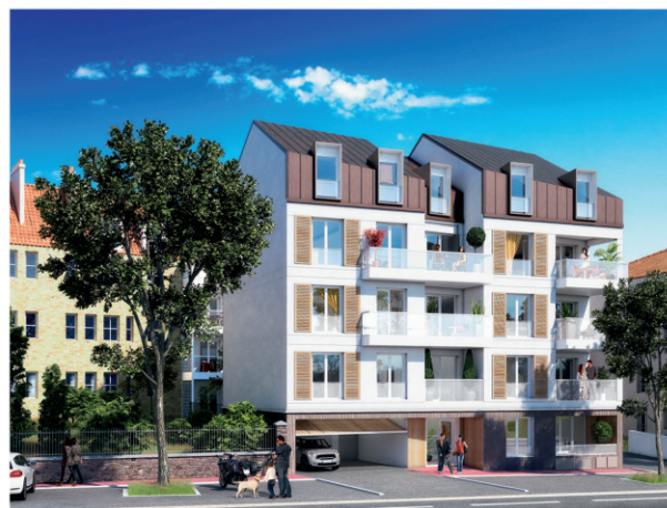
Les Miroirs - 134, avenue du général Leclerc - Viroflay 15 appartements - cabinet d'architectes : Brelan d'Arch Livraison prévisionnelle 2 e trimestre 2020