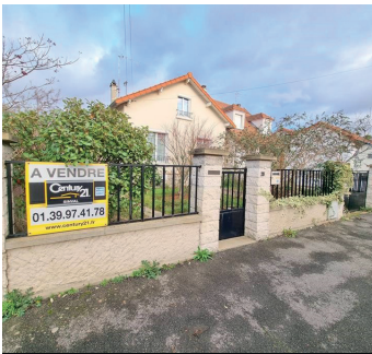
HERBLAY SUR SEINE 385 000€