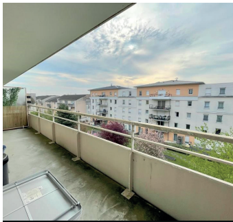
HERBLAY SUR SEINE 170 000€