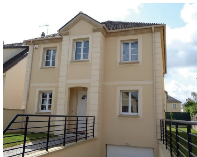
HERBLAY SUR SEINE - 136 M 2 2 112,69 €/MOIS