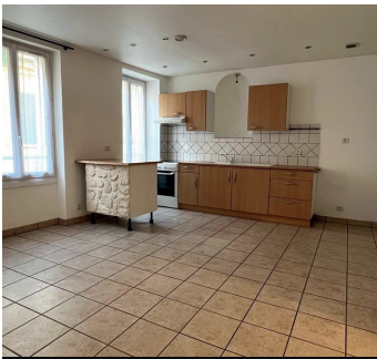
HERBLAY SUR SEINE 139 000€