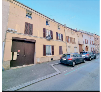
HERBLAY SUR SEINE 159 800€