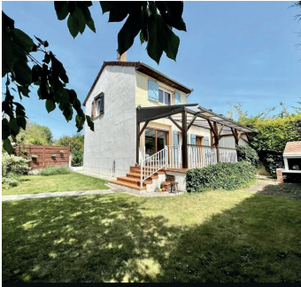
HERBLAY SUR SEINE 441 000€