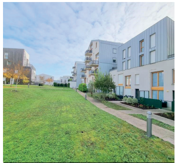
HERBLAY SUR SEINE 216 000€