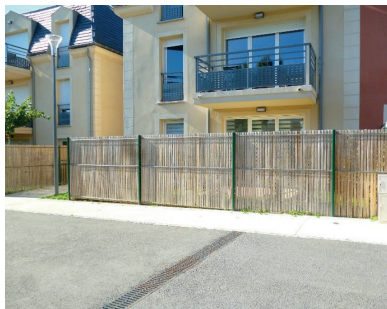
HERBLAY SUR SEINE

Magnifique 2 pièces, avec terrasse et jardin clos. Offrant entrée, séjour avec cuisine ouvert donnant sur belle terrasse, 1 chambre, salle d'eau avec WC, place de parking privée. DPE : NC