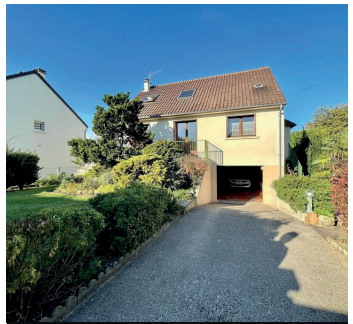
HERBLAY SUR SEINE 429 000€