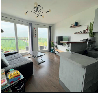
HERBLAY SUR SEINE 234 000€