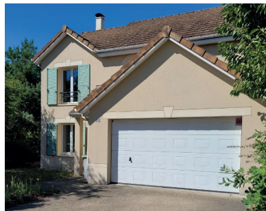
HERBLAY SUR SEINE

RDC : entrée, salon, salle à manger, cuisine ouverte équipée, cellier, garage. A l'étage : 4 chambres dont 1 parentale, rangements, 1 SDE, 1 SDB, dégagement, 2 WC, jardin clos et intime de 535m 2 . DPE : NC