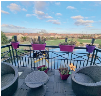
HERBLAY SUR SEINE 279 000€