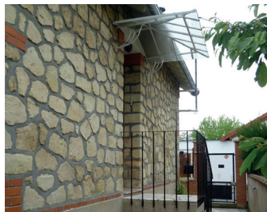
LA FRETTE SUR SEINE - 1 105,50 €/MOIS