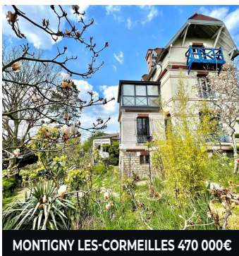
MONTIGNY LES-CORMEILLES 470 000€