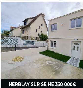
HERBLAY SUR SEINE 330 000€