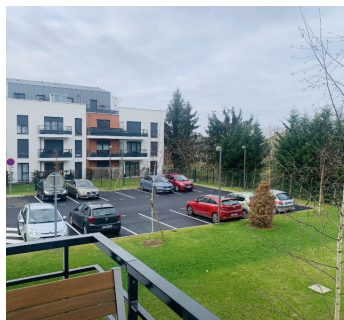
HERBLAY SUR SEINE 188 500€