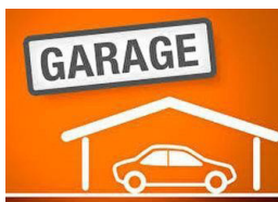
HERBLAY CENTRE Box de 13m 2 situé dans une petite résidence sécurisée HERBLAY SUR SEINE. 90€/MOIS.