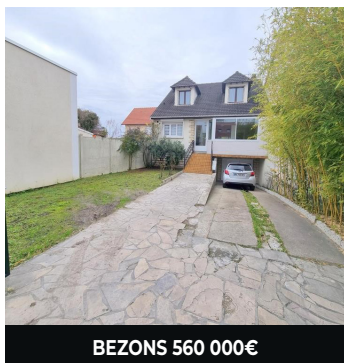
BEZONS 560 000€