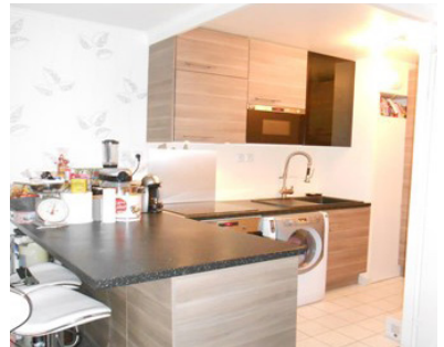
FRANCONVILLE A DEUX PAS DE LA GARE BEAU STUDIO, bien agencé : entrée, salle de bains avec WC, pièce principale ouverte sur cuisine aménagée. Balcon. 1 place de parking extérieure. DPE : NC 651,64 €/MOIS