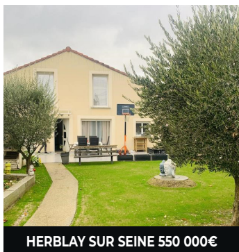
HERBLAY SUR SEINE 550 000€