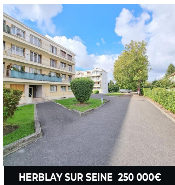
HERBLAY SUR SEINE 250 000€