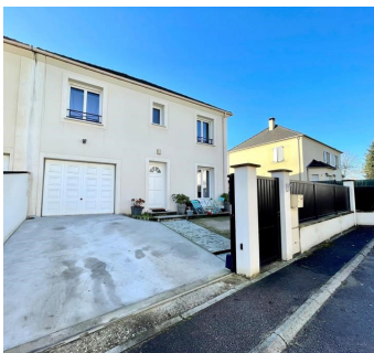
HERBLAY SUR SEINE 410 000€