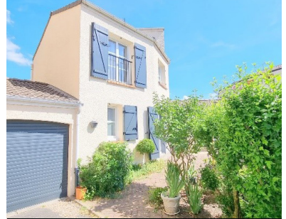
HERBLAY SUR SEINE 1390€ /MOIS