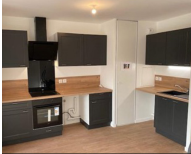
HERBLAY SUR SEINE 880€/ MOIS