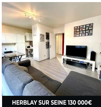
HERBLAY SUR SEINE 130 000€