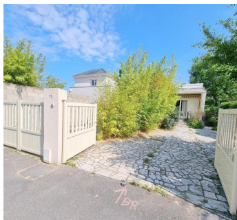
HERBLAY SUR SEINE 315 000€