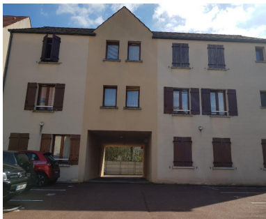
HERBLAY SUR SEINE Appartement de 2 pièces, en plein centre-ville, offrant : beau séjour spacieux, cuisine, chambre, salle de bains avec WC, place de parking extérieure. DPE : NC 850€/MOIS.