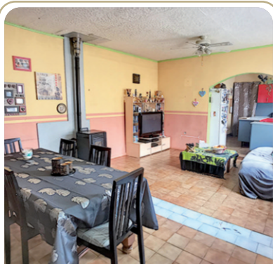
ARGENTEUIL 01 34 34 63 21

ARGENTEUIL, LIMITE BEZONS Pavillon de plain pied : entrée, séjour, cuisine ouverte, 3 chambres, sdb, wc, jardin privatif, un stationnement. Le tout proches des transports et des écoles. Copropriété : Nb de lots : 5, Budget prévisionnel (dépenses courantes) : 1€/an.