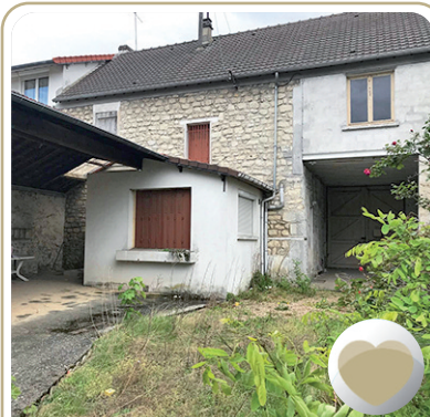
TAVERNY 01 39 60 26 76

PIERRELAYE Vous êtes amoureux de l'ancien et avez de l'or entre les mains ? Venez découvrir trois bien à rénover. Issus d'une division, avec cour commune de 91m 2 . Lot 1 : Une maison de 163m 2 avec cave voutée et 2 stationnements. Lot 2 : Une ancienne écurie de 51m 2 à réhabiliter en habitation et 2 stationnements. Lot 3 : Un hangar avec permis de construire et 2 stationnements. DPE : E