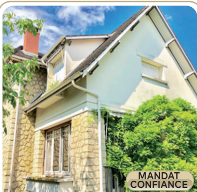
SANNOIS 01 39 80 18 99

SANNOIS QUARTIER VOLTAIRE Belle maison de 6 pièces élevées sur sous-sol total avec garage, buanderie et pièces. Elle comprend : une entrée, cuisine, séjour triple de 33m 2 , deux chambres, bureau, sdb et wc. Beau jardin. Proche de l'école NOTRE DAME, QUARTIER RECHERCHE ! DPE : F