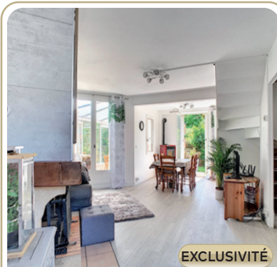
JOUY LE MOUTIER 01 34 41 64 90

JOUY LE MOUTIER Grande maison familiale sur trois niveaux et plus de 130m 2 , idéalement située à proximité écoles, commerces, transports et centre-ville. Entrée avec placard, wc indépendant, séjour lumineux équipé d'un poêle à bois et d'une véranda (8m 2 ), cuisiné avec verrière et accès direct au jardin et garage buanderie. Au deuxième étage 4 chs, sdb, une sde, et un escalier pour mener au dernier niveau aménagé en une spacieuse suite parentale de 30m 2 au sol. DPE : E