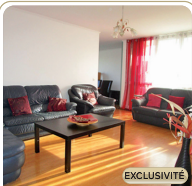
MONTIGNY LES CORMEILLES 01 39 97 03 62

MONTIGNY-LÈS-CORMEILLES Belle appartement de cinq pièces principales proche toute commodité avec une place de parking sécurisé comprenant : entrée, séjour lumineux, belle cuisine indépendante, salle à manger, trois chambres, salle de bains, salle d'eau, WC, dégagement, rangement. Il n'attend que vous. DPE : D