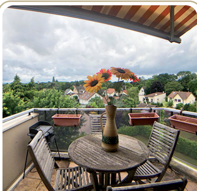
BEAUCHAMP 01 30 40 06 39

BEAUCHAMP RER C / Ligne H. Accès A15 et A115. A deux pas d'une école élémentaire, au dernier étage d'une résidence calme avec ascenseur, cet appartement de type F4 propose, entrée, dressing, séjour double et balcon exposé sud, cuisine, buanderie, 2 ch dont une avec SDE, SDB et WC séparé. Stationnement privatif en sous-sol. Très rare sur Beauchamp. DPE : D