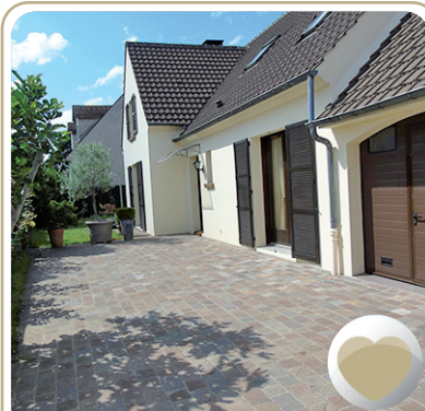
CORMEILLES EN PARISIS 01 39 31 77 05

Cormeilles-en-Parisis A 15 min à pieds de la gare, superbe maison traditionnelle individuelle comprenant : entrée cathédrale, séjour double, cuisine indépendante, suite parentale, point d'eau, WC. A 1er : palier desservant 4 chambres dont 1 en passage, bureau. Terrasse. Garage et 2nd stationnement couvert. Terrain environ 360 m 2 . DPE : E