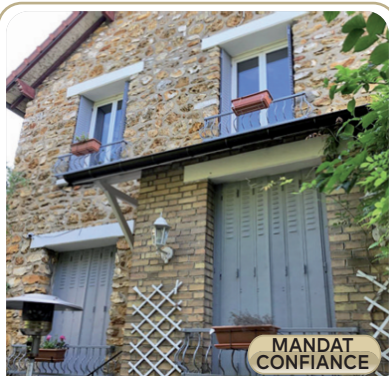
EAUBONNE 01 39 59 00 18

EAUBONNE QUARTIER PAUL BERT ! Authentique meulière offrant : entrée, séj. dble, cuisine ouverte sur l'ext., wc, à l'étage : 2 gdes chbres, bureau, SdE + wc. Comble amgée en suite parentale (SdB et wc). S/sol total + garage, 3 stationnements ext. Jardin privatif de 440 m 2 . DPE : D Honoraires charge vendeur