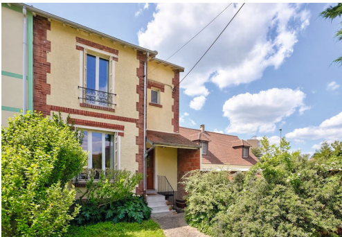
Rue du Général Leclerc - CHATOU