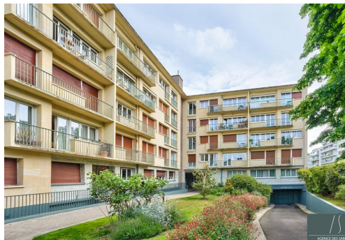
Rue du Petit Montesson - LE VÉSINET