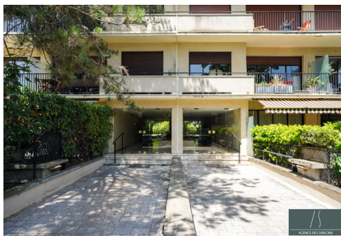
Rue des Charmes - LE VÉSINET