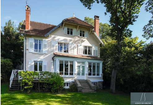
Allée de la Meute - LE VÉSINET