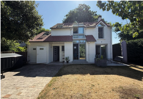
Avenue des Courlis - LE VÉSINET