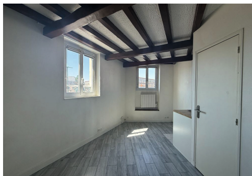
Route de la Passerelle - LE VÉSINET