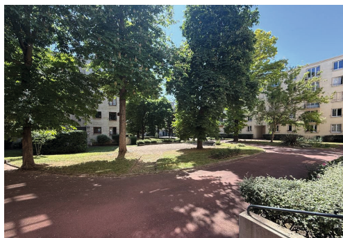
Rue Villebois Mareuil - LE VÉSINET