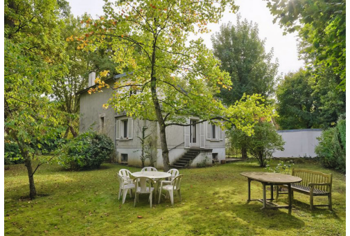
Avenue Horace Vernet - LE VÉSINET