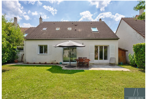
Rue Antoine de Saint Exupéry - MONTESSON