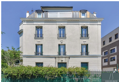
Avenue Gallieni - LE VÉSINET