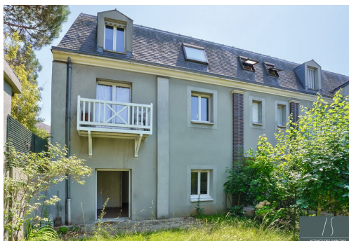
Rue des Charmes - LE VÉSINET