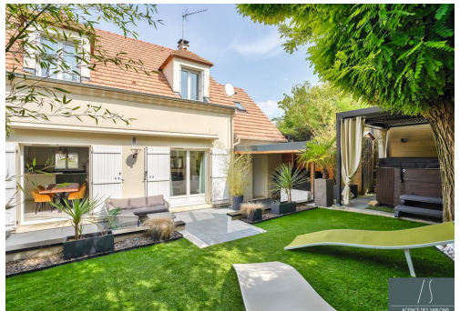
Allée des Pressoirs - MONTESSON