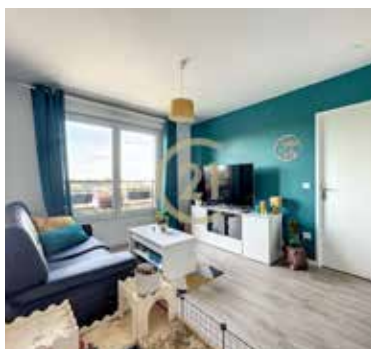
JOUY LE MOUTIER 159 000€