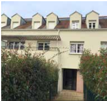
HERBLAY SUR SEINE 202 599€