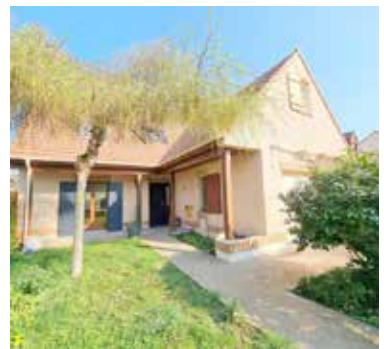
HERBLAY SUR SEINE 645 800€