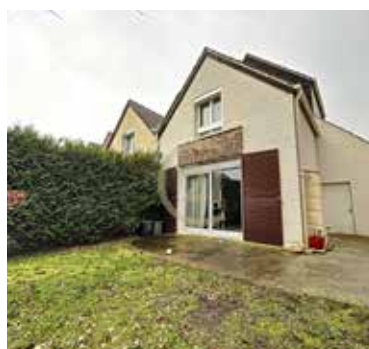
JOUY LE MOUTIER 320 000€