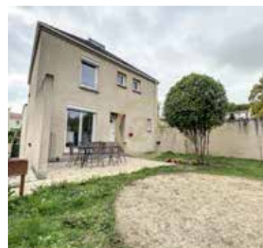
JOUY LE MOUTIER 347 500€