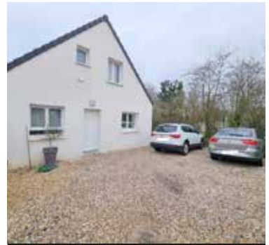
HERBLAY SUR SEINE 397 000€