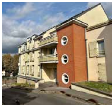
MONTIGNY-LES-CORMEILLES 238 000€