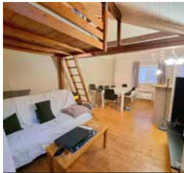
HERBLAY SUR SEINE 125 000€