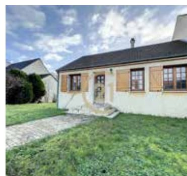
NEUVILLE SUR OISE 339 150€