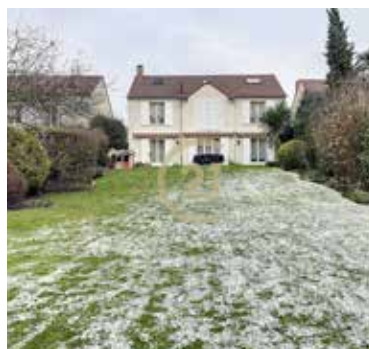
NEUVILLE SUR OISE 649 000€