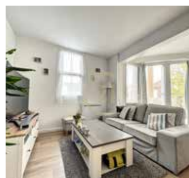
JOUY LE MOUTIER 219 900€