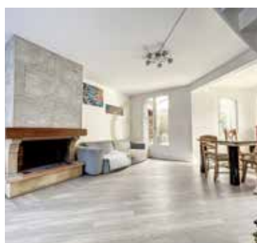
JOUY LE MOUTIER 315 000€