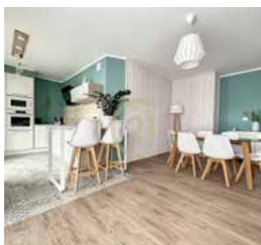
JOUY LE MOUTIER 295 000€