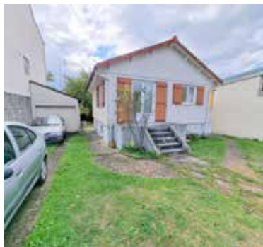
HERBLAY SUR SEINE 275 000€