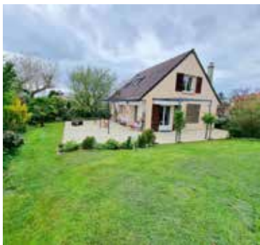
HERBLAY SUR SEINE 432 000€