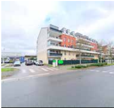
HERBLAY SUR SEINE 147 000€