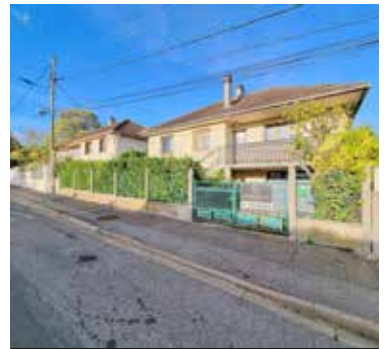
HERBLAY SUR SEINE 340 000€