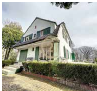
BOISEMENT 480 000€