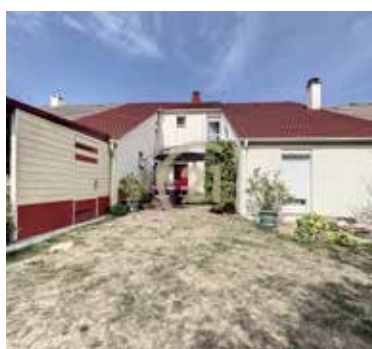
JOUY LE MOUTIER 325 000€