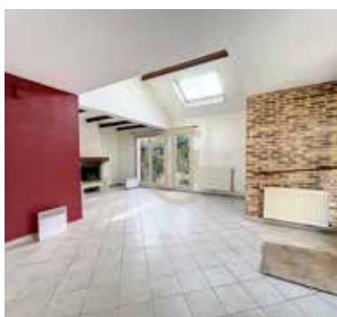
JOUY LE MOUTIER 364 000€