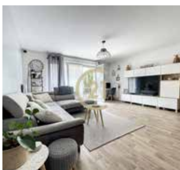
JOUY LE MOUTIER 295 000€