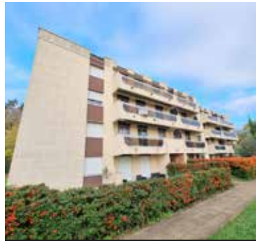
HERBLAY SUR SEINE 475 000€