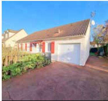
HERBLAY SUR SEINE 360 000€