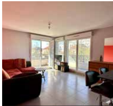
HERBLAY SUR SEINE 215 000€